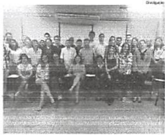
Micro e pequenos empresários industriais maranhenses beneficiados

O Núcleo de Inovação da Federação das Indústrias do Maranhão (Fiemma), em parceria com o Instituto Evandro Lodi (IEL) e o Programa de Desenvolvimento de Empreendedores (PEDE), realizou recentemente o primeiro dia de sessões de consultoria coletiva, atendendo e bebidas, moda e alimentos. Participaram do Projeto Cas-